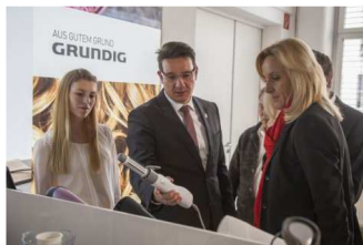
Zum Auftakt in Nürnberg zeigte Grundig erstmals das gesamte Home Electronics Sortiment