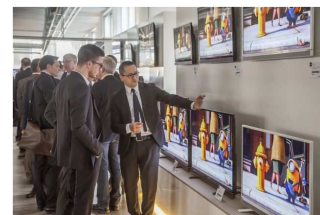
Erfolgreicher Jahresauftakt auf den Grundig Jahresstartmessen

Nürnberg, 3. Februar: Neuer Besucherrekord: Knapp 700 Handelspartner konnten auf den Jahresstartmessen in Nürnberg, Köln und Hamburg die Grundig Smart Home Electronics Trends für 2016 erleben. Besonders das neue Premium TV Line-up Immensa fand bei dem Fachpublikum großen Anklang. Schon der Auftakt in der dritten Januar-Woche war mehr als gelungen: Mit seinem gesamten Home Electronics Sortiment und über 400 Besuchern konnte Grundig eine neue Bestmarke in seiner Heimatstadt aufstellen.