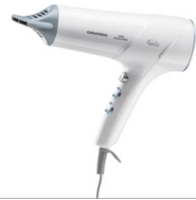
Vitalität, Sprungkraft und eine Extraportion Glanz: Schonendes Styling beginnt schon beim Haare trocknen

Die richtige Pflege fängt schon vor dem eigentlichen Styling an: Neben Shampoo, Haarkur & Co entscheidet auch die Wahl des Haartrockners über das gepflegte Aussehen der Haare. Denn gerade in nassem oder feuchtem Zustand sind sie besonders empfindlich. Zu heißes oder langes Föhnen kann daher schnell bleibende Schäden hinterlassen. Mit seinem keramikbeschichteten Düsengitter schützt der Grundig Haartrockner HD 7581 die Haarfasern vor dem Austrocknen und verleiht ihnen dank seiner antistatischen Ionic-Funktion gleichzeitig mehr Vitalität und Sprungkraft. Die professionelle Stylingdüse sowie der abnehmbare Volumen-Diffusor machen den Haartrockner mit 2300 Watt dabei zum leistungsstarken Styling-Tool für glatte, lockige und voluminöse Looks.