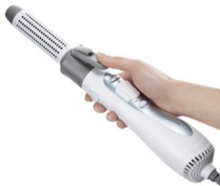
Der rotierende Volumen- und Lockenstyler HS 6520 von Grundig schont strapaziertes Haar und sorgt für tolle Looks