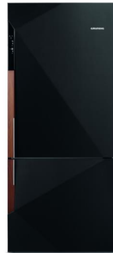
Mit der edlen Carbonfaser Oberfläche ist der GKN 3000 Carbon das optische Highlight in jeder Küche

Neben der Produktneuheit stellt Grundig zur A30 Küchenmeile seine überarbeitete Befestigungstechnik vor, welche in die neuen Kühl- und Gefrierkombination der Marke integriert wird: Die Easy Door Installation ist ein Schraubsystem, mit dem die Tür einfach am Gehäuse ausgerichtet werden kann. Dadurch können Geräte auch zuhause schnell und optisch professionell eingebaut werden. Ob nach oben, links oder nach vorne – die Tür lässt sich in alle Richtungen passend verstellen. Das System ist für alle Möbelfronten, wie zum Beispiel Kassetten, Landhaus oder auch grifflose Fronten geeignet.