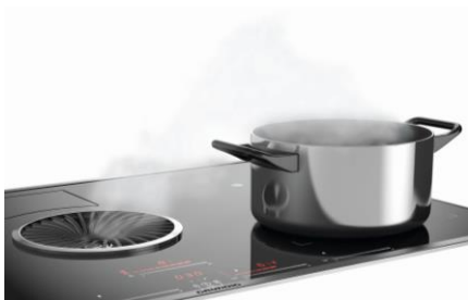
Das GIEH 824470 X saugt Dampf dank Muldenlüfter und Hob & Hood Technologie automatisch ab