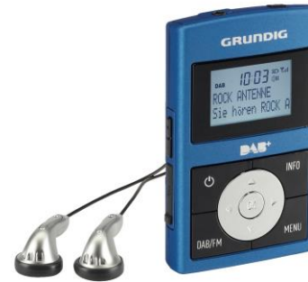
Das digitale Taschenradio Micro 75 DAB+ garantiert beste Sendervielfalt

Wer beim Laufen gerne den aktuellen Hits aus dem Radio lauscht, der ist mit einem Taschenradio gut beraten. Für eine größere Sendervielfalt empfiehlt sich ein digitales Radiogerät, wie zum Beispiel das Micro 75 DAB+. Bis zu 10 digitale und 10 analoge Lieblingssender lassen sich hier speichern. Die sechs festprogrammierten Equalizer-Einstellungen verleihen jedem Song außerdem die passende Prise Classic, Rock, Jazz, Pop, Normal oder Speech. Große Tasten und eine übersichtliche Menüführung sorgen für eine einfache Bedienung, auch wenn es gerade über Stock und Stein geht.