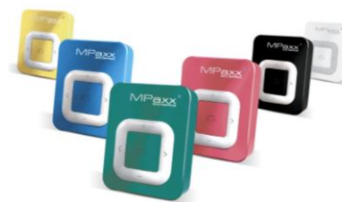
Die bunten Mini Music Player Mpaxx 941 gibt es in sechs leuchtenden Farben

... mit den kunterbunten Mpaxx 941 kein Problem, denn die handlichen Mini Music Player kommen in sechs leuchtenden Farben und sind damit die absoluten Must-haves der Laufsaison. Mit nur knapp 25 Gramm bringen die kleinen Geräte kaum Gewicht auf die Waage und eignen sich so bestens als Laufbegleiter. Einfach ans Shirt oder Armband geklippt, einen von bis zu 999 Songs ausgewählt und schon kann es losgehen – gerne auch für 10h-Marathons, denn so lange hält der wiederaufladbare Hochleistungsakku. Und das Beste: Die automatische Abschaltung schützt vor ungewolltem Stromverlust.