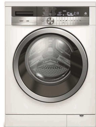
Mit dem Waschvollautomaten GWN 58474 C wäscht sich die Wäsche fast von alleine.

Nürnberg, 7. August 2014: Der Grundig Waschvollautomat GWN 58474 C ist der ideale Haushaltshelfer: Mit Hilfe der ProDose-Dosierautomatik wird die Menge an Flüssigwaschmittel und Weichspüler optimal dosiert – unabhängig von der Beladung der Waschtrommel. Damit wird die Wäsche immer perfekt gereinigt und Waschmittelrückstände gehören genauso der Vergangenheit an wie allergische Reaktionen, die durch den übermäßigen Einsatz von Waschmittel hervorgerufen werden können. Die MultiSense-Technologie optimiert die Waschtemperatur und schlägt automatisch Einstellungen vor – die Programme können dann manuell übernommen oder individuell angepasst werden.