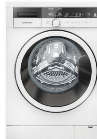
Bis zu 8 kg Wäsche treffen auf 84 x 60 x 61 cm: Der GWN 48430