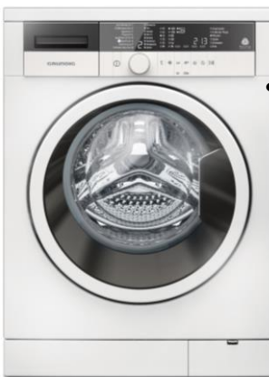
Klein, aber fein: Der Waschvollautomat GWN 36630 hat Platz für 6 kg Wäsche

Nürnberg, 04. März 2015: Die neuen Grundig Waschvollautomaten GWN 36630, GWN 57442 C und GWN 48430 stärken das Elektrogroßgeräte-Segment des europäischen Vollsortimenters und gehen auf die unterschiedlichen Bedürfnisse deutscher Haushalte ein. Dabei überzeugen sie nicht nur mit optimalen Waschergebnissen in gewohnt klassisch-modernem Grundig-Design. Alle drei Waschvollautomaten verfügen über 16 umfangreiche Waschprogramme, dem Wasserschutz WaterProtect+ und sind mit dem energiesparenden EcoMotor ausgestattet, der mit der Energieeffizienzklasse A+++ glänzt.