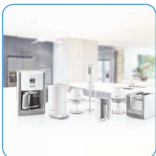
White Sense Serie