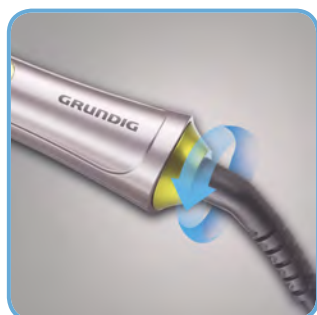
Professionelles Kabel mit Drehgelenk