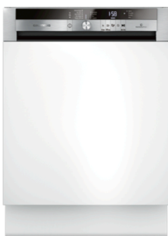
Außen elegant, innen robust: Der GNI 41835 X